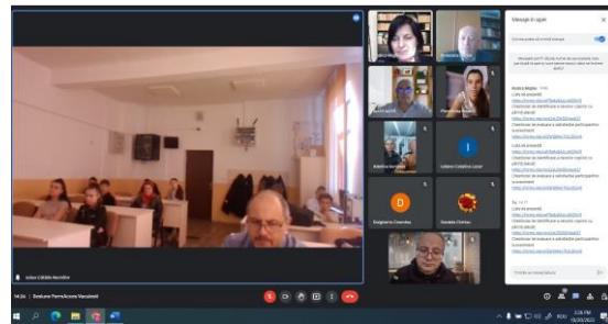
Sesiune Școala gimnazială nr. 1 Văculești

În cadrul lunii octombrie s-au desfășurat ca și în celelalte luni de implementare ale proiectului 4 sesiuni după cum urmează: