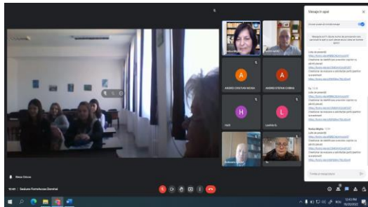
Sesiune Școala gimnazială Spiru Haret Dorohoi