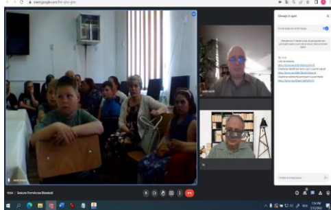
Sesiune Școala gimnazială nr. 1 Blândești

Pentru asigurarea fluidității comunicării în cadrul proiectului, lunar se desfășoară și sesiunile pentru ”stabilirea și dezvoltarea de parteneriate între școli, autorități locale, instituții locale, ONG-uri și comunitate, în vederea sprijinirii copiilor din județul Botoșani cu părinți plecați în străinătate desfășurate în cadrul proiectului”.