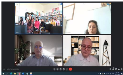
Sesiune Școala gimnazială Tiberiu Crudu Tudora