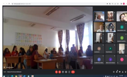
Sesiune Liceul Ștefan D. Luchian Ștefănești

Sesiunile au prilejuit diseminarea de informații elocvente pentru gradul de îndeplinire al obiectivelor proiectului, fiind reiterată importanța deosebită pe care, din această perspectivă o are atât în prezent cât și în perspectivă parteneriatul stabilit între instituțiile școlare, autoritățile locale, alte instituții locale, ONG-uri și comunitate pentru implementarea cu succes a proiectului și conservarea bunelor practici ale acestuia.