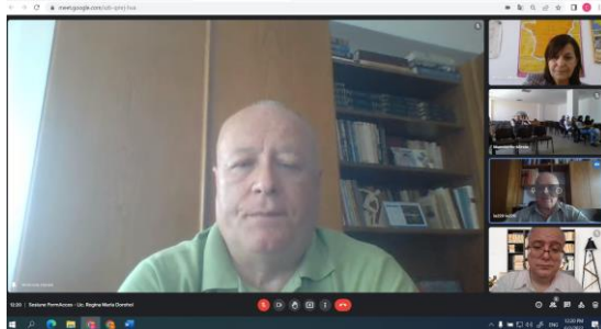
Sesiune Liceul Regina Maria Dorohoi

implementare. Printre activitățile care au avut o frecvență lunară, fiind necesare pentru asigurarea transparenței și a unei bune comunicări între participanții la proiect se enumeră sesiunile pentru ”stabilirea și dezvoltarea de parteneriate între școli, autorități locale, instituții locale, ONG-uri și comunitate, în vederea sprijinirii copiilor din județul Botoșani cu părinți plecați în străinătate desfășurate în cadrul proiectului”.