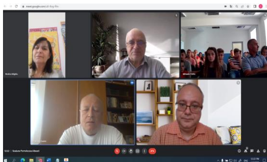
Sesiune Școala gimnazială Tudor Vladimirescu Albești