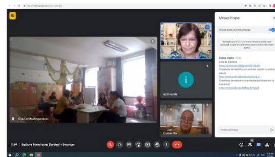
Sesiune G.P.P. „Ștefan cel Mare și Sfânt” Dorohoi și Șc. prof. „Sf. Ap. Andrei” Smârdan