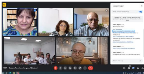
Sesiune Școala gimnazială nr. 1 Știubieni