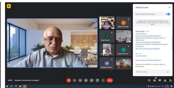
Sesiune Școala gimnazială nr. 1 Corlăteni