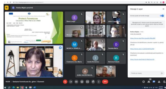
Sesiune Școala gimnazială nr. 1 Dumeni