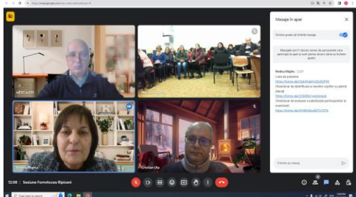
Sesiune Școala gimnazială nr. 1 Ripiceni