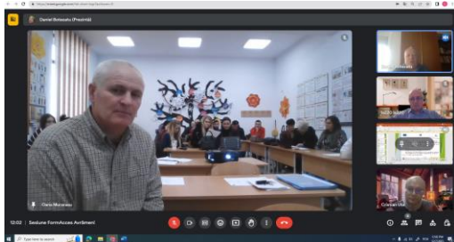
Sesiune Școala gimnazială nr. 1 Avrămeni