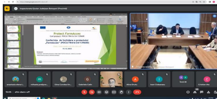
Conferința de închidere a proiectului FormAcces, decembrie 2023