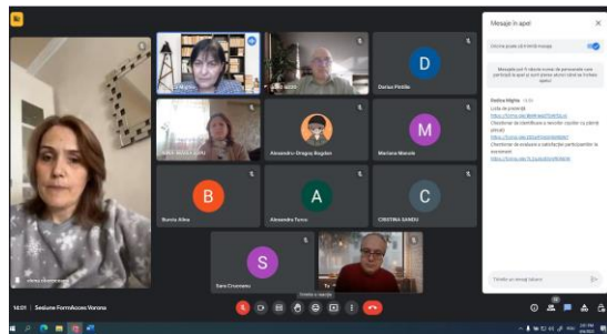
Sesiune Liceul Tehnologic Vorona