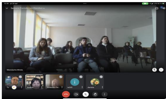
Sesiune Liceul „Regina Maria” Dorohoi