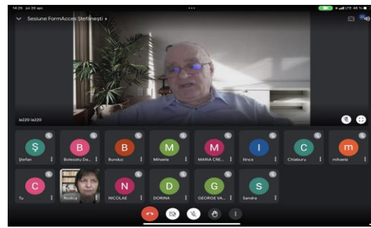
Sesiune Liceul „Ștefan D. Luchian” Ștefănești