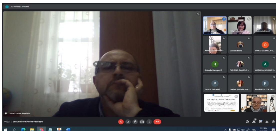
Sesiune Școala gimnazială nr. 1 Văculești