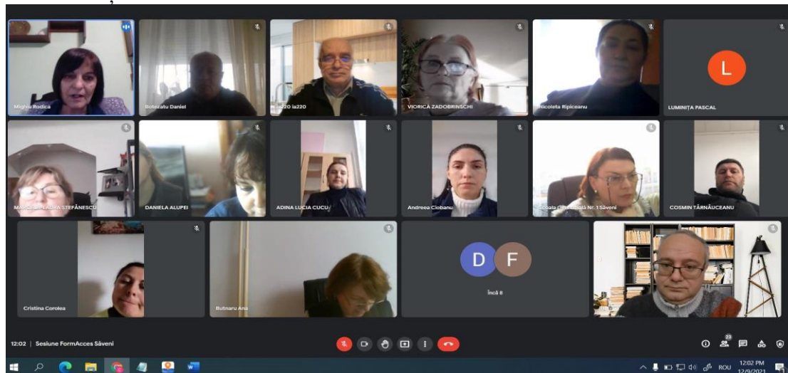
Sesiune Școala gimnazială nr. 1 Săveni

În cadrul acestor întâlniri, se remarcă un dialog activ între participanți, care este foarte util din perspectiva diseminării informațiilor referitoare la proiect și la activitățile derulate în cadrul acestuia. Astfel, experții din cadrul proiectului au realizat ca de fiecare dată o trecere în revistă a stadiului de implementare și a gradului de îndeplinire a obiectivelor specifice ale proiectului prin prisma rezultatelor obținute. De un interes aparte s-au bucurat și informațiile oferite cu privire la activitatea de implementarea a parteneriatelor strategice între instituțiile școlare, reprezentanți ai mediului de afaceri și administrația locală.