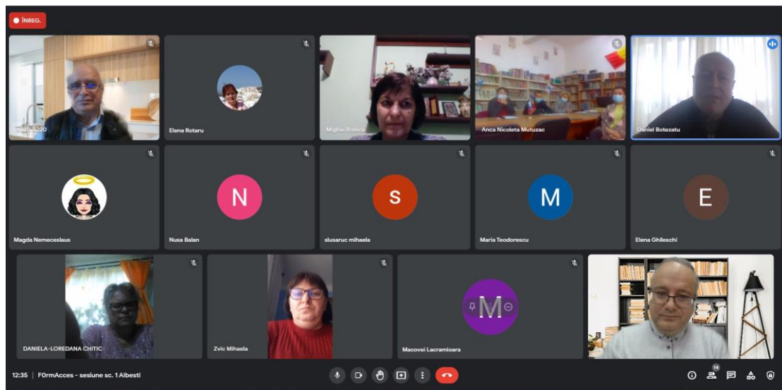
Sesiune – Școala gimnazială Albești nr. 1

Pentru atingerea obiectivelor specifice ale proiectului, și, prin extensie, a obiectivului general, în condiții corespunzătoare, o activitate suport esențială constă în efortul de identificare corectă și oportună a nevoilor specifice a copiilor care sunt introduși în grupul țintă și care vor beneficia efectiv de activitățile din cadrul proiectului. Pentru identificarea acestor nevoi, și pentru facilitarea dialogului activ între participanții la proiect și experți s-au organizat și în cadrul lunii octombrie un număr de 4 sesiuni. În data de 14 octombrie s-au desfășurat 2 sesiuni, una la Școala gimnazială nr. 1 și una la Școala gimnazială nr. 2 Tudor Vladimirescu, ambele din comuna Albești\