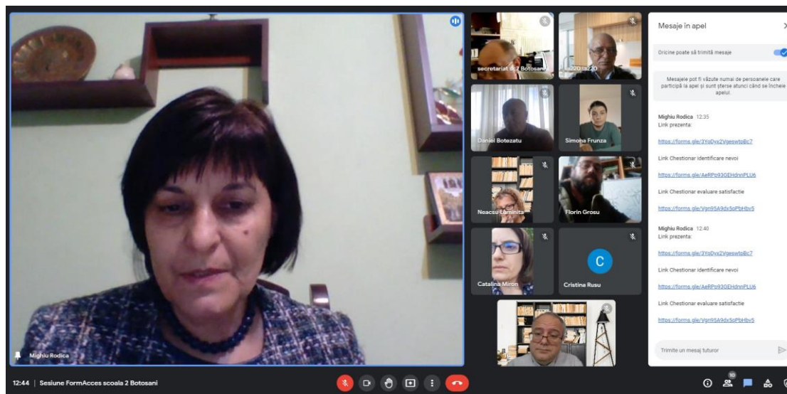
Sesiune – Școala gimnazială nr. 2 Botoșani

Ulterior s-au mai desfășurat alte 2 întâlniri, în data de 21 octombrie la Școala gimnazială nr. 2 și la Școala gimnazială Ștefan cel Mare, ambele din Botoșani.