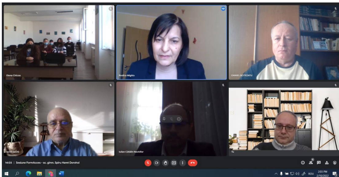
Sesiune Școala gimnazială „Spiru Haret” Dorohoi

În cadrul lunii februarie au avut loc 4 astfel de sesiuni astfel: